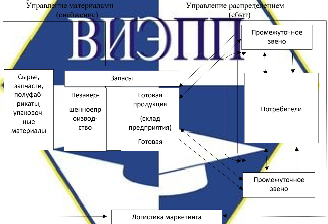
Рисунок 1 – Принципы логистической системы

Иллюстрации должны иметь наименование и, если необходимо, пояснительные данные (подрисуночный текст). Слово «Рисунок», его номер и через тире наименование помещают после пояснительных данных и располагают в центре под рисунком без точки в конце (рис.1).