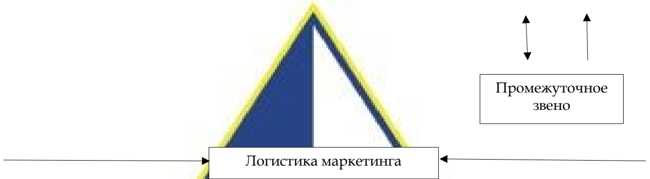
Рисунок 1 – Принципы логистической системы Рисунок 1 – Пример оформления рисунка

Если наименование рисунка состоит из нескольких строк, то его следует записывать через один межстрочный интервал. Наименование рисунка приводят с прописной буквы. Перенос слов в наименовании графического материала не допускается.