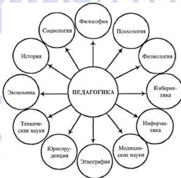
Рисунок 1 – Связь педагогики с другими науками

Иллюстрации должны иметь наименование и, если необходимо, пояснительные данные (подрисуночный текст). Слово «Рисунок», его номер и через тире наименование помещают после пояснительных данных и располагают в центре под рисунком без точки в конце (рис.1).