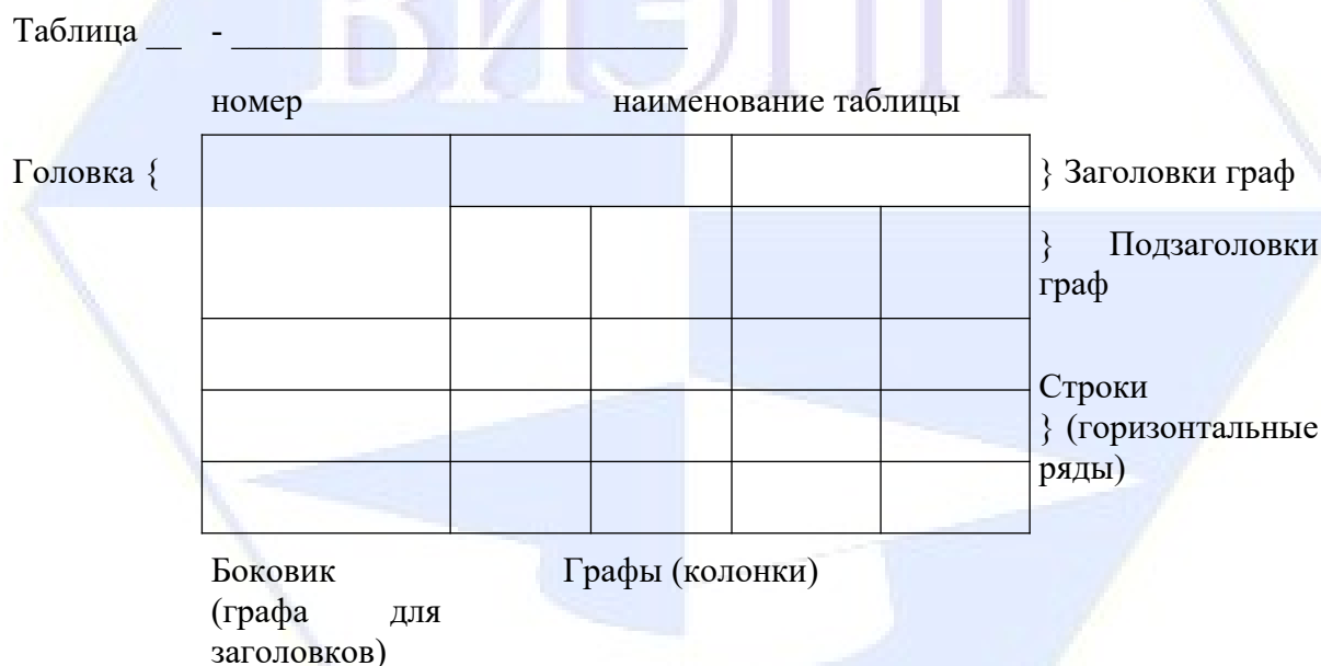
Рисунок 2 – Макет таблицы

После таблицы должно быть оставлено не менее одной свободной строки.