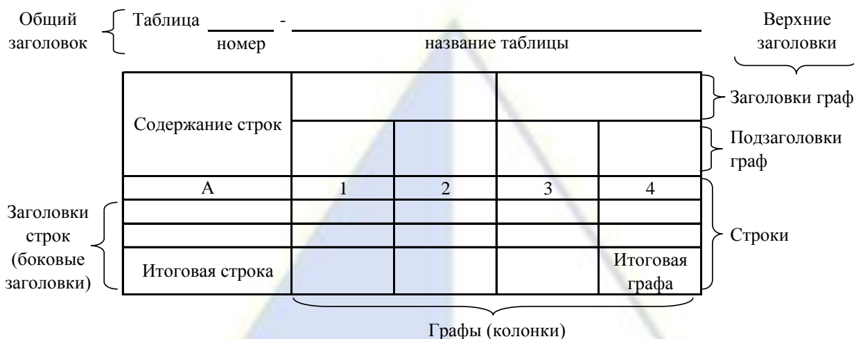
Рисунок 2 – Остов (основа) таблицы

Таблицы, используемые в выпускной квалификационной работе, размещают под текстом, в котором впервые дана ссылка на них, или на следующей странице, а при необходимости – в приложении.