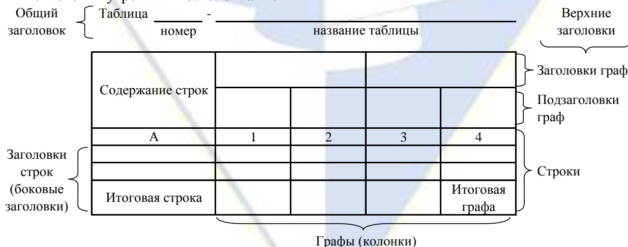
Рисунок 2 – Остов (основа) таблицы

Цифровой материал, как правило, оформляют в виде таблиц. Таблица содержит три вида заголовков: общий, верхние и боковые (рис. 2). Общий заголовок отражает содержание всей таблицы (к какому месту и времени она относится), располагается над ее макетом и является внешним заголовком. Верхние заголовки характеризуют содержание граф, а боковые – строк. Они являются внутренними заголовками.