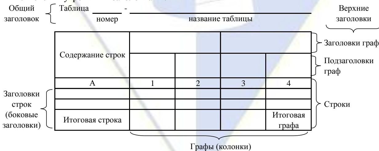
Рисунок 2 – Остов (основа) таблицы

Цифровой материал, как правило, оформляют в виде таблиц. Таблица содержит три вида заголовков: общий, верхние и боковые (рис. 2). Общий заголовок отражает содержание всей таблицы (к какому месту и времени она относится), располагается над ее макетом и является внешним заголовком. Верхние заголовки характеризуют содержание граф, а боковые – строк. Они являются внутренними заголовками.