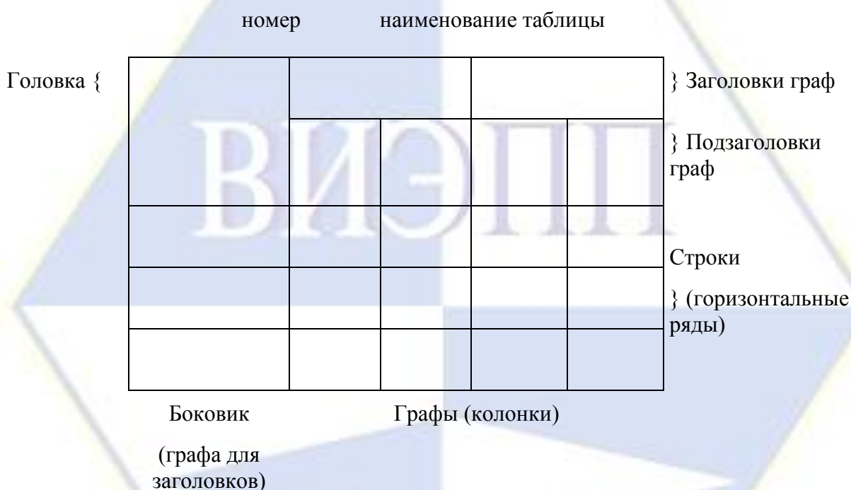
Рисунок 2 – Макет таблицы

Таблицы, за исключением таблиц приложений, следует нумеровать арабскими цифрами сквозной нумерацией.