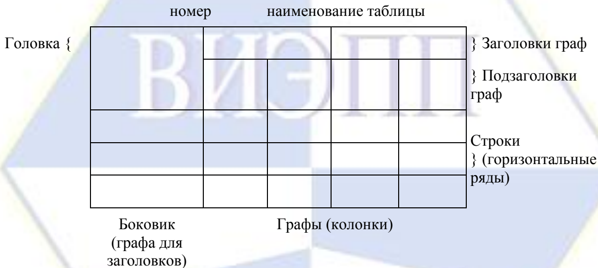
Рисунок 2 – Макет таблицы

Таблицы, за исключением таблиц приложений, следует нумеровать арабскими цифрами сквозной нумерацией.