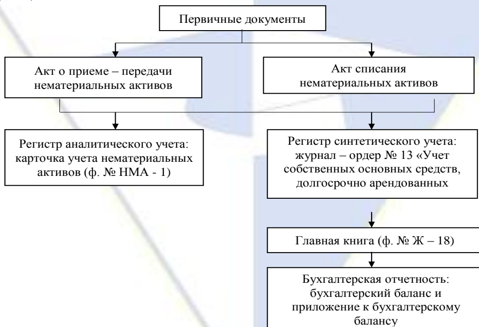
Рисунок 3.1 - Схема движения бухгалтерской информации по счету 04 «Нематериальные активы» по журнально-ордерной и автоматизированной формам бухгалтерского учета

Иллюстрации должны иметь наименование и, если необходимо, пояснительные данные (подрисуночный текст). Слово «Рисунок», его номер и через тире наименование помещают после пояснительных данных и располагают в центре под рисунком без точки в конце (рис.1):