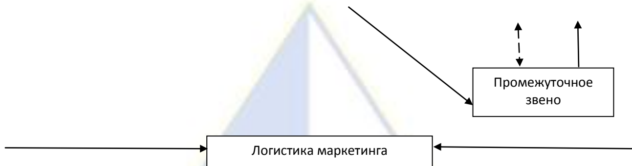
Рисунок 1 – Принципы логистической системы